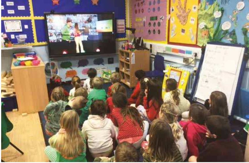
Dyma ddosbarth Idwal yn ymuno gyda pharti pen-blwydd Mr Urdd

'Roedd bwrlwm yn yr ysgol wrth i bawb ddatlu pen-blwydd yr Urdd yn 100 oed! Dysgodd pawb gân Hei Mr Urdd! ar gyfer ymgais torri record byd yn ogystal â gwisgo dillad coch, gwyn a gwyrdd ac ymuno gyda pharti arbennig ar lein. Diolch i'r Urdd am y profiadau gwych y maent wedi ei cynnig i blant yr ysgol dros y blynyddoedd.